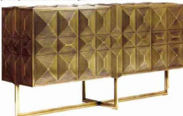
Ci-dessous Erwan Boulloud, Console , 2016, laiton, 88 x 165 x 45 cm ©GALERIE GLUSTIN, SAINT-OUEN.