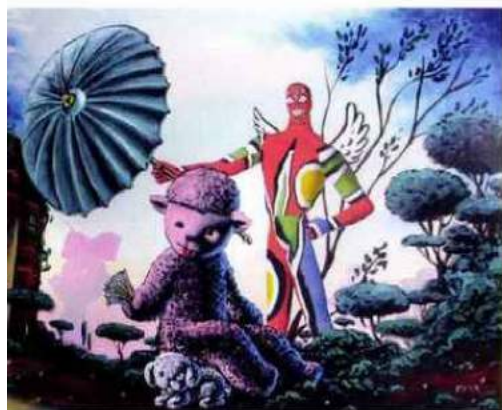
Ci-dessus Maya Patrick, Le Parasol (Hommage à Goya) , 2011, acrylique et impression sur toile, 81 x 100 cm GALERIE ART FONTAINEBLEAU, FONTAINEBLEAU.

ART ÉLYSÉES-ART & DESIGN, et 8 e AVENUE, avenue des Champs-Élysées (de la place Clemenceau à la place de la Concorde), 75008 Paris, 01 49 28 51 30, www.artelysees.fr et www.8e-avenue.com du 19 au 23 octobre.