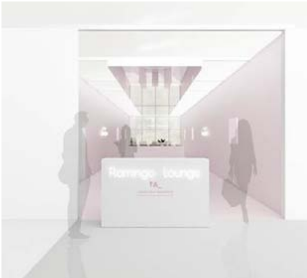
Préfiguration du Collectors Lounge 2016, Design Miami/.