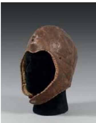
Le bonnet d'aviateur de Charles Lindbergh.