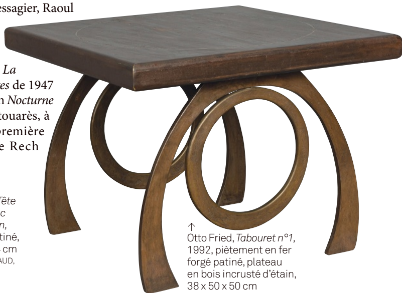
↑ Otto Fried, Tabouret n°1 , 1992, piètement en fer forgé patiné, plateau en bois incrusté d'étain, 38 x 50 x 50 cm