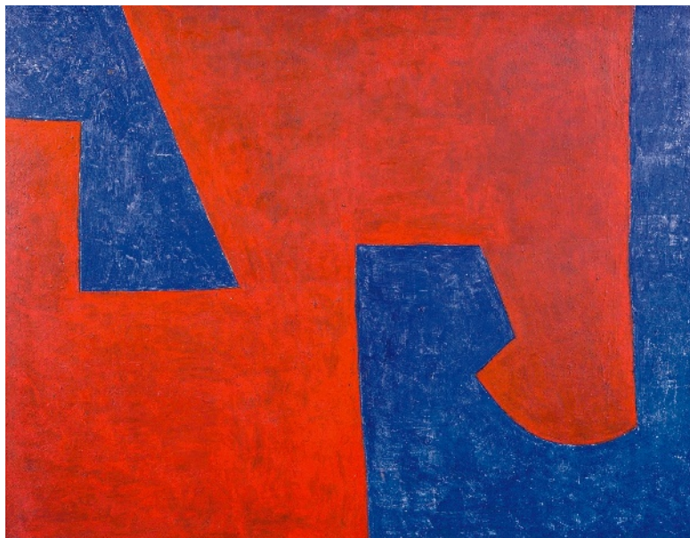
← Serge Poliakoff, Bleu rouge , 1951, huile sur toile, 89 x 116 cm