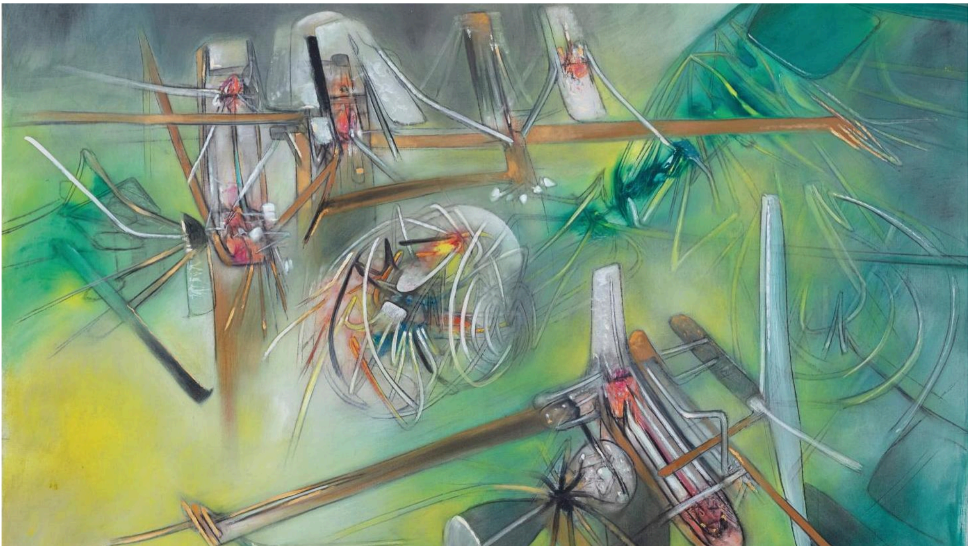
Roberto Matta (1911-2002), Objet du dialogue , 1956, huile sur toile, 46 x 209 cm. Galerie Mitterrand.

À trois jours d'Art Basel Paris, l'association Matignon Saint-Honoré ouvre les festivités et crée un nouveau rendez-vous, dans un quartier devenu le hub du marché haut de gamme.