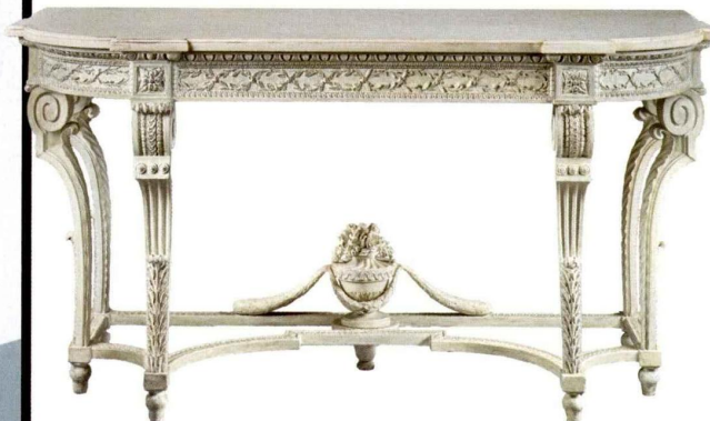
Georges Jacob Console livrée pour la princesse de Conti, 1776, bois, marbre de Carrare, 95 x 183 x 73 cm ©GALERIE LÉAGE, PARIS.