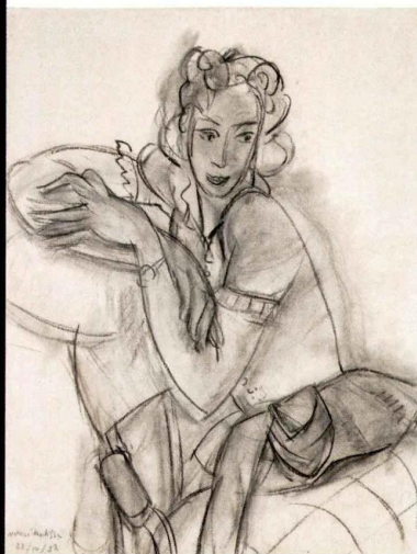
Henri Matisse Portrait d'Hélène Mercier, étude pour Le Chant , Nice, 22 octobre 1938, fusain et estampe sur papier, 65,5 x 50,5 cm