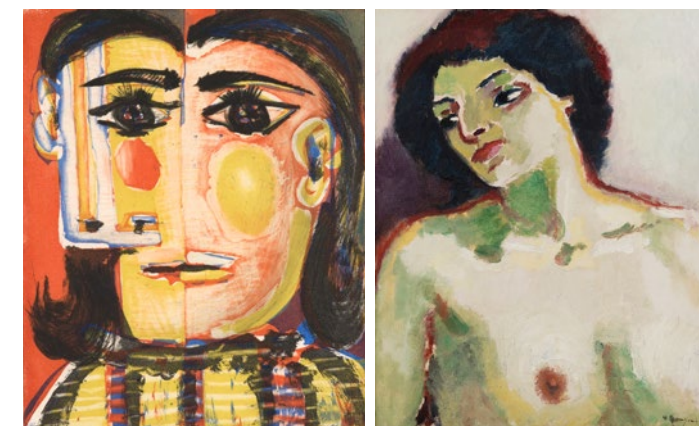
Pablo Picasso, Tête de femme No. 5, 1939-1942. Kees Van Dongen, Fernande Olivier, 1911.