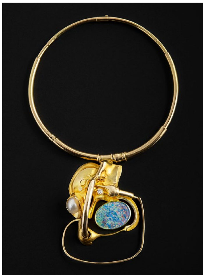
Pièce unique de Claude Wesel pour Fernand Demaret Studio.

Côté belge, parmi les habitués et plus anciens exposants comme Axel Vervoordt ou N. Vrouyr, cinq nouveaux venus exposeront en juin 2022 à Brussels Expo: la Collectors Gallery, Thomas Deprez Fine Art, Galerie Kraemer + Ars Belga, MDZ Gallery et la QG Gallery. La Collectors Gallery au Sablon à Bruxelles est spécialisée dans les bijoux et objets d'artistes et designers des XX e et XXI e siècles. Elle propose des œuvres d'art à porter, signées, entre