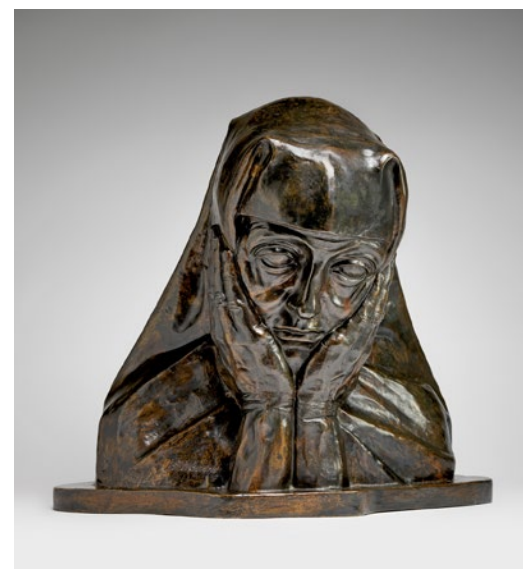
George Minne, Oraison , 1894