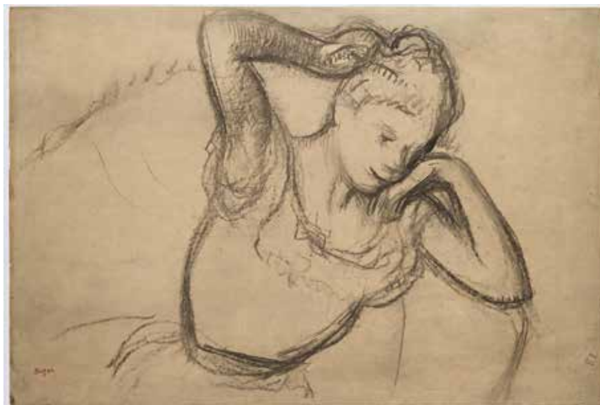
Эдгар Дега. «Бюст танцовщицы». 1896 г.

В этом сезоне пандемия все-таки внесла свои коррективы в юбилейные торжества: с привычного марта смотр передвинулся на июль, а девять галерей из США и Азии до дворцовых залов не доедут – для них, как и других участников, продолжит работать онлайн-версия Salon du Dessin. Тем не менее более 30 ведущих маршанов со всей Европы составят впечатляющую картину истории