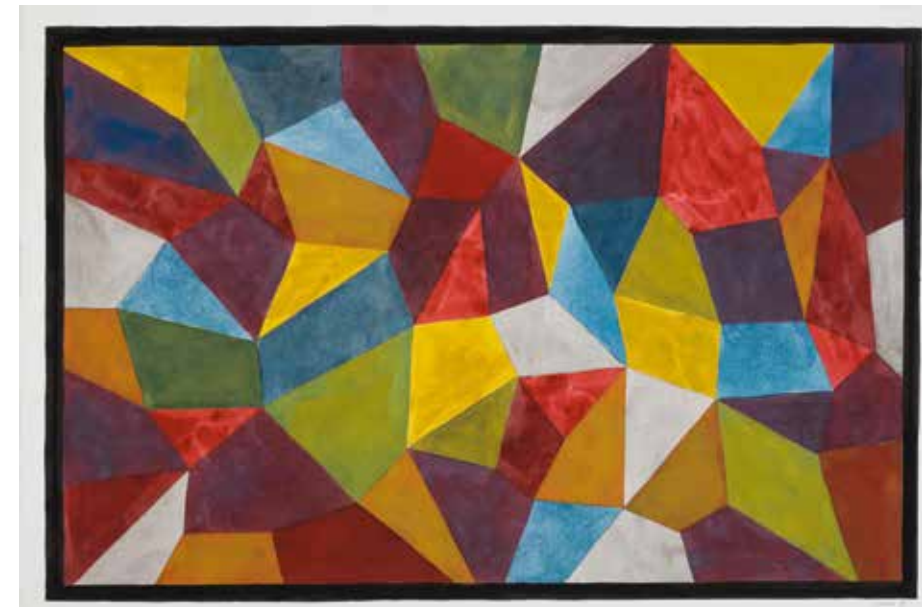
Сол Левитт. «Композиция 1988». 1988 г.