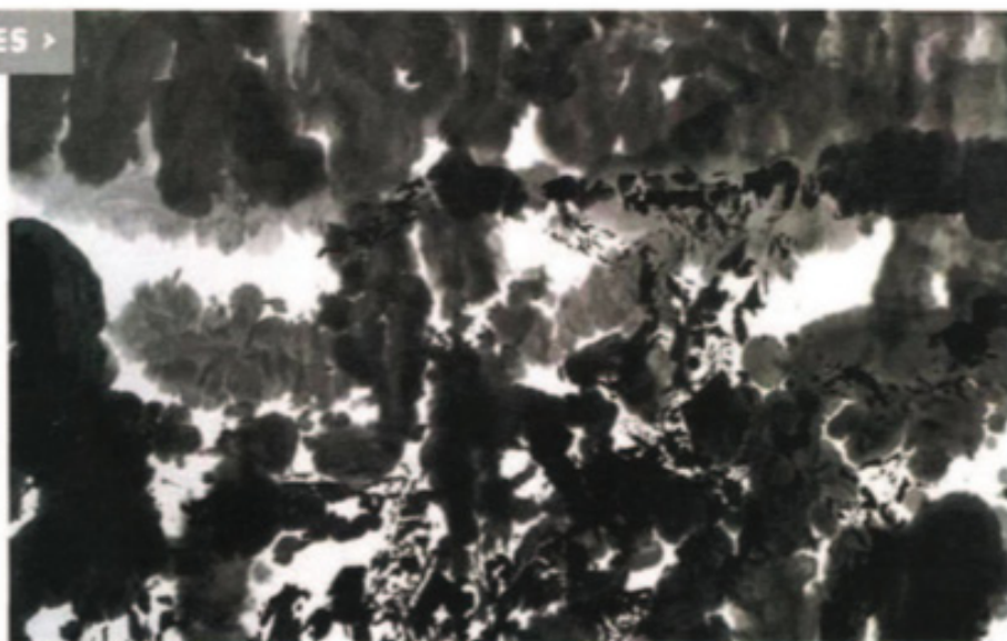
« Sans titre », Zao Wou-Ki (Akris Gallery).

Le Salon Art Paris Art Fair, qui se déroule la semaine prochaine au Grand Palais, met à l'honneur la scène artistique sud-asiatique, actuellement en pleine effervescence. Tour d'horizon en avant-première.