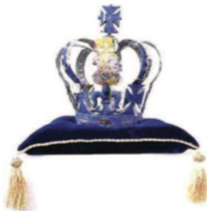
« Crown », Isabel et Alfredo Aquilizan (Mélina Bailly Gallery).