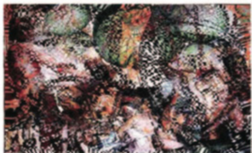
« Sans titre », Dinh Q. Lê (10 Chancery Lane Gallery).