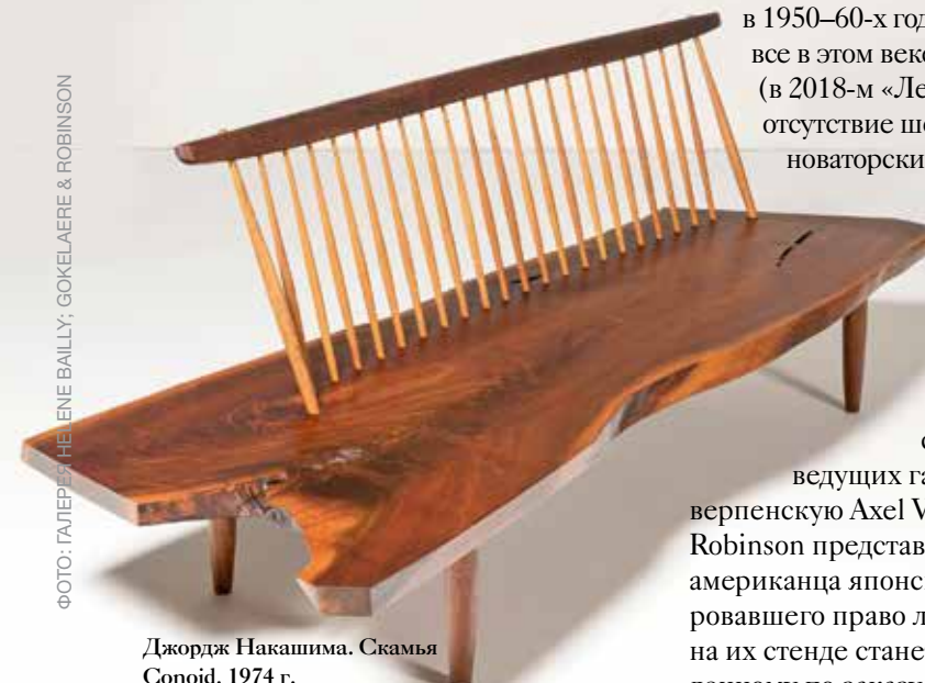
Джордж Накашима. Скамья Conoid. 1974 г.

Дизайн – еще одна важная секция BRAFA, без которой сегодня трудно представить любую ярмарку антиквариата или современного искусства. В ней выставляются сразу несколько ведущих галерей из разных стран, включая парижскую Maison Rapin, антверпенскую Axel Vervoordt и московскую Heritage. Брюссельская же Gokelaere & Robinson представит подборку выдающихся международных дизайнеров, включая американца японского происхождения Джорджа Накашиму, некогда манифестировавшего право любого дерева на «вторую жизнь». Одним из объектов мастера на их стенде станет культовая скамья Conoid – уникальность каждому произведенному по заказу экземпляру обеспечивала сама природа. ■