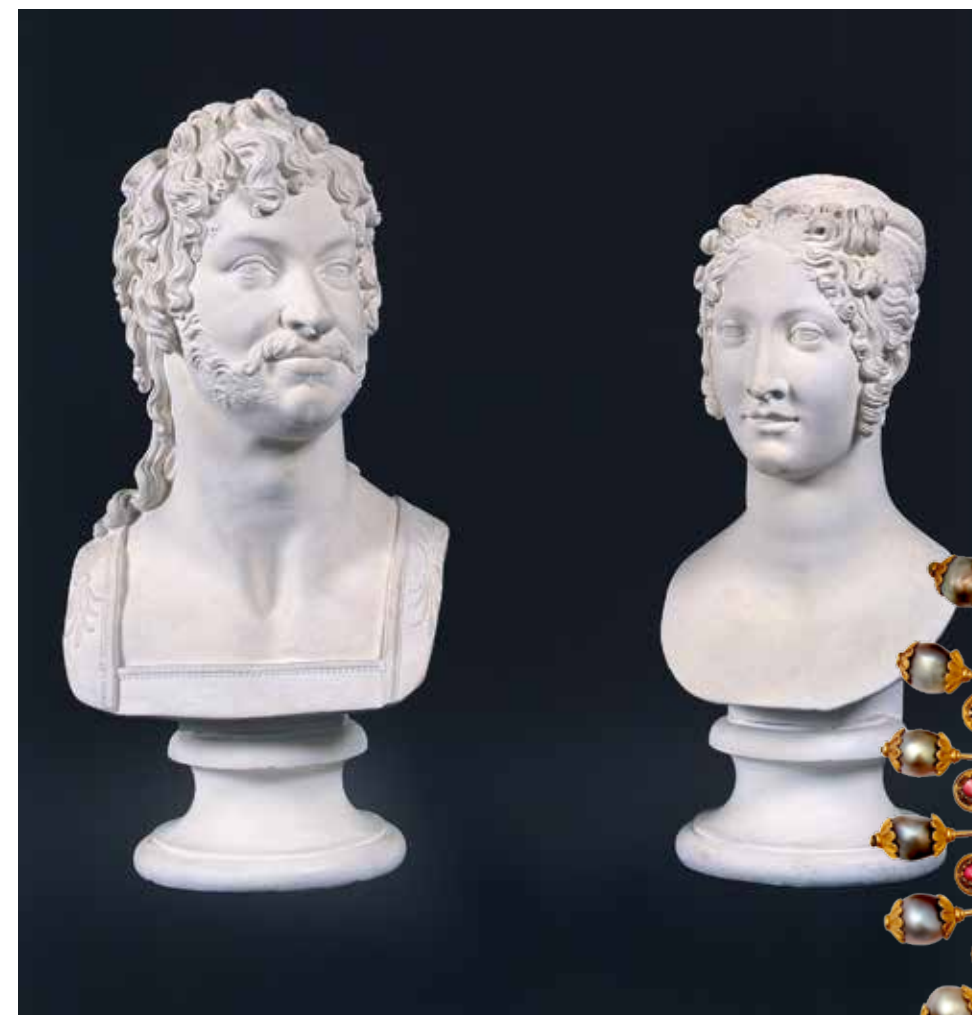
Антонио Канова. Бюсты Каролины Бонапарт и Иоахима Мюрата. Около 1813 г.

Совсем недавно одна из самых известных бельгийских галерей De Jonckheere со штаб-квартирой в Женеве открыла новое направление деятельности, связанное с модернизмом. Но то, чего от нее ждут коллекционеры на ярмарке прежде всего, – это, конечно, старые мастера, специализируясь на которых, дилеры сделали себе имя по обе стороны океана. Разочарований не будет и на этот раз: