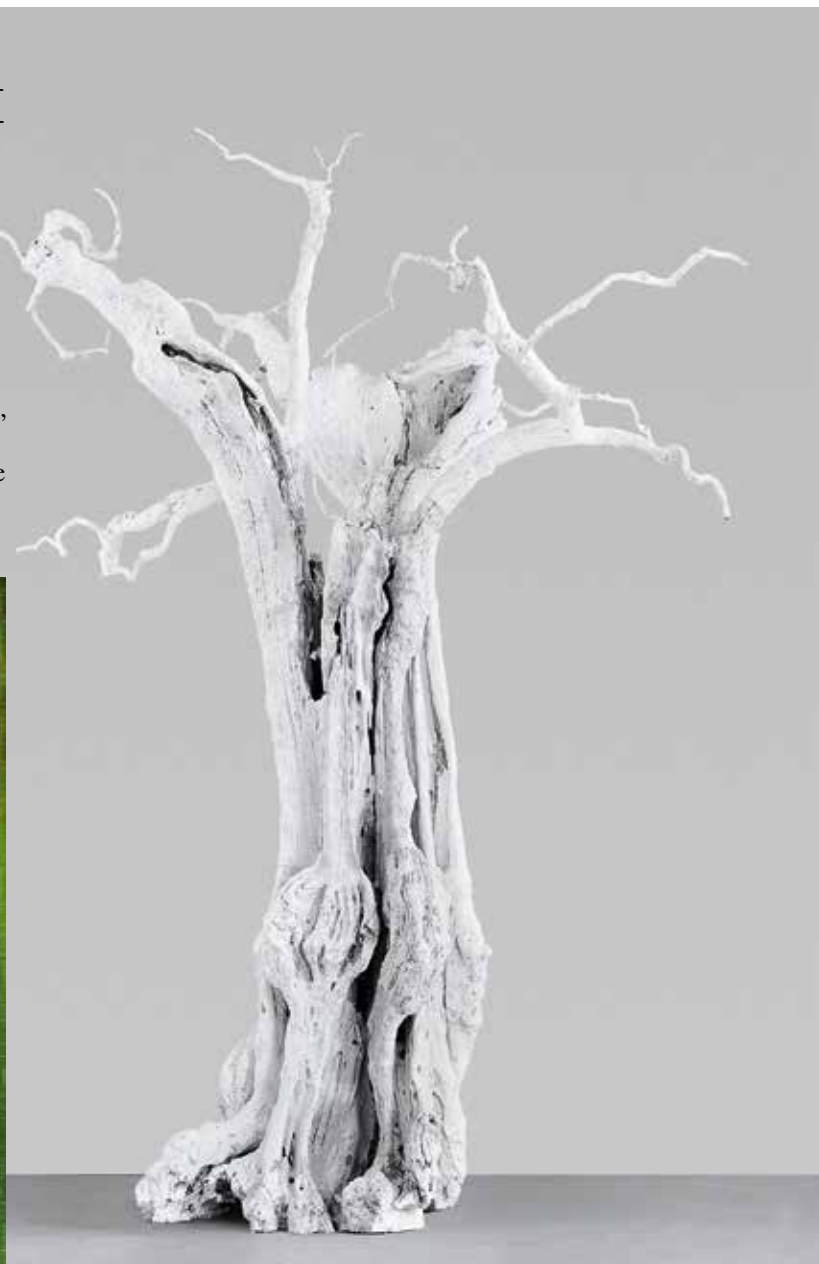
Уго Рондиноне. «Лунный цветок». 2011 г.

ПОМИМО АРТ-ШЕДЕВРОВ, НА 65-Й ЯРМАРКЕ BRAFA ПРОЙДЕТ БЛАГОТВОРИТЕЛЬНАЯ ПРОДАЖА ПЯТИ ФРАГМЕНТОВ БЕРЛИНСКОЙ СТЕНЫ