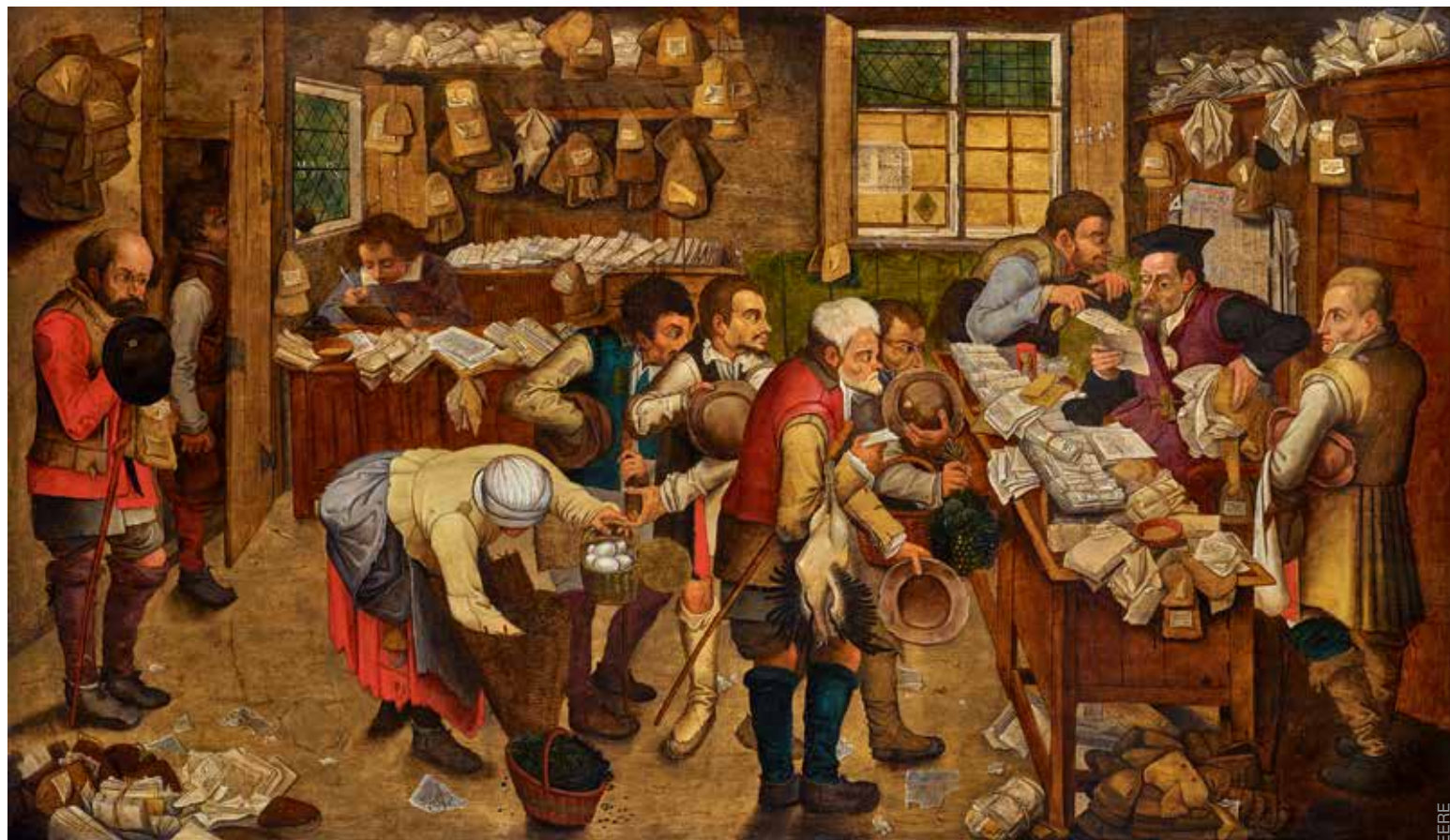
Питер Брейгель Младший. «Сбор налогов, или Деревенский адвокат». 1620-е гг.

С 26 января по 2 февраля в Брюсселе пройдет одна из старейших в мире ярмарок искусства BRAFA. В 65-й раз она соберет более 130 международных галерей с работами на любой вкус, от античных статуй и полотен старых мастеров до комиксов и дизайна. MY WAY выбрал десять самых эмблематичных произведений. ТЕКСТ | ОЛЕГ КРАСНОВ