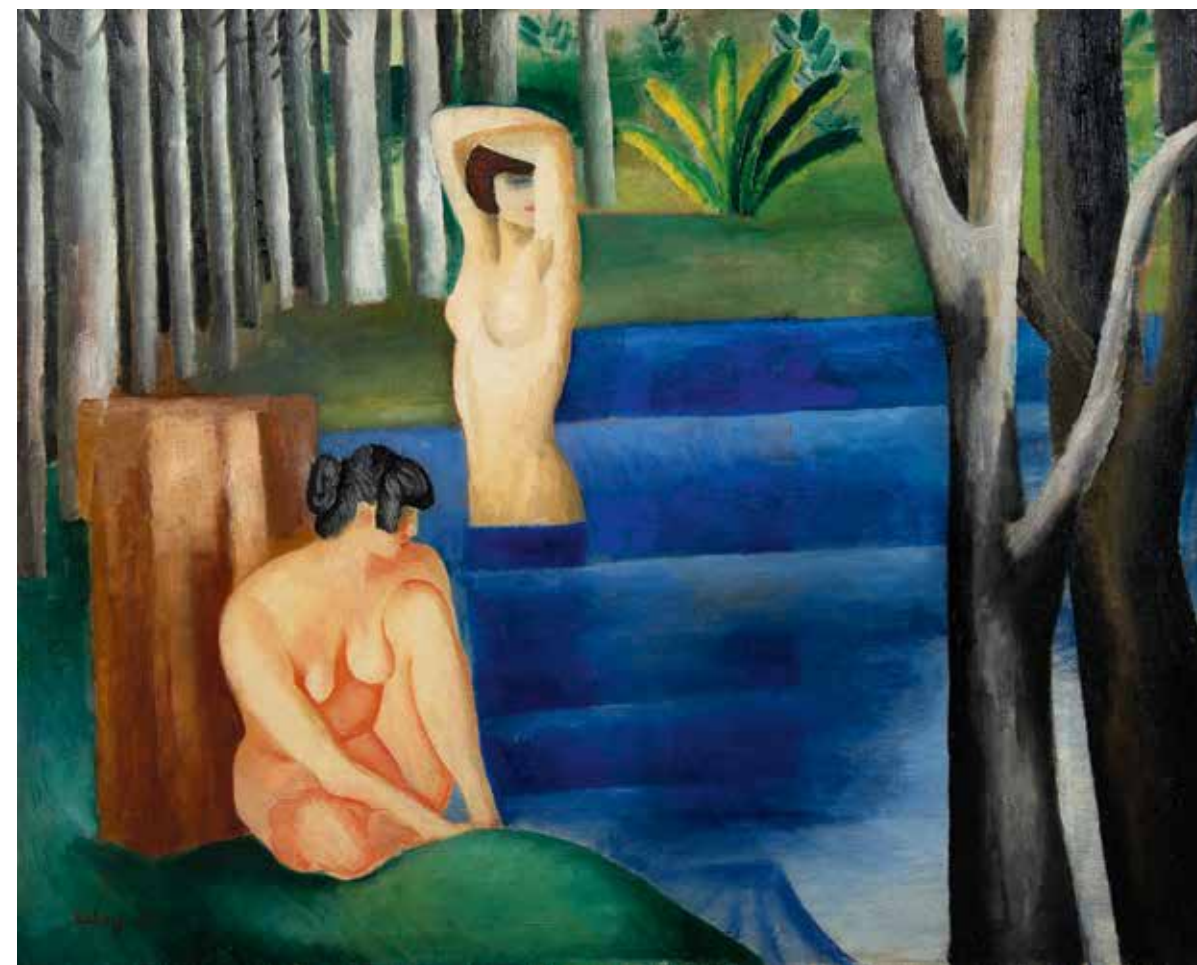
Моисей Кислинг. «Две купальщицы». 1917 г.