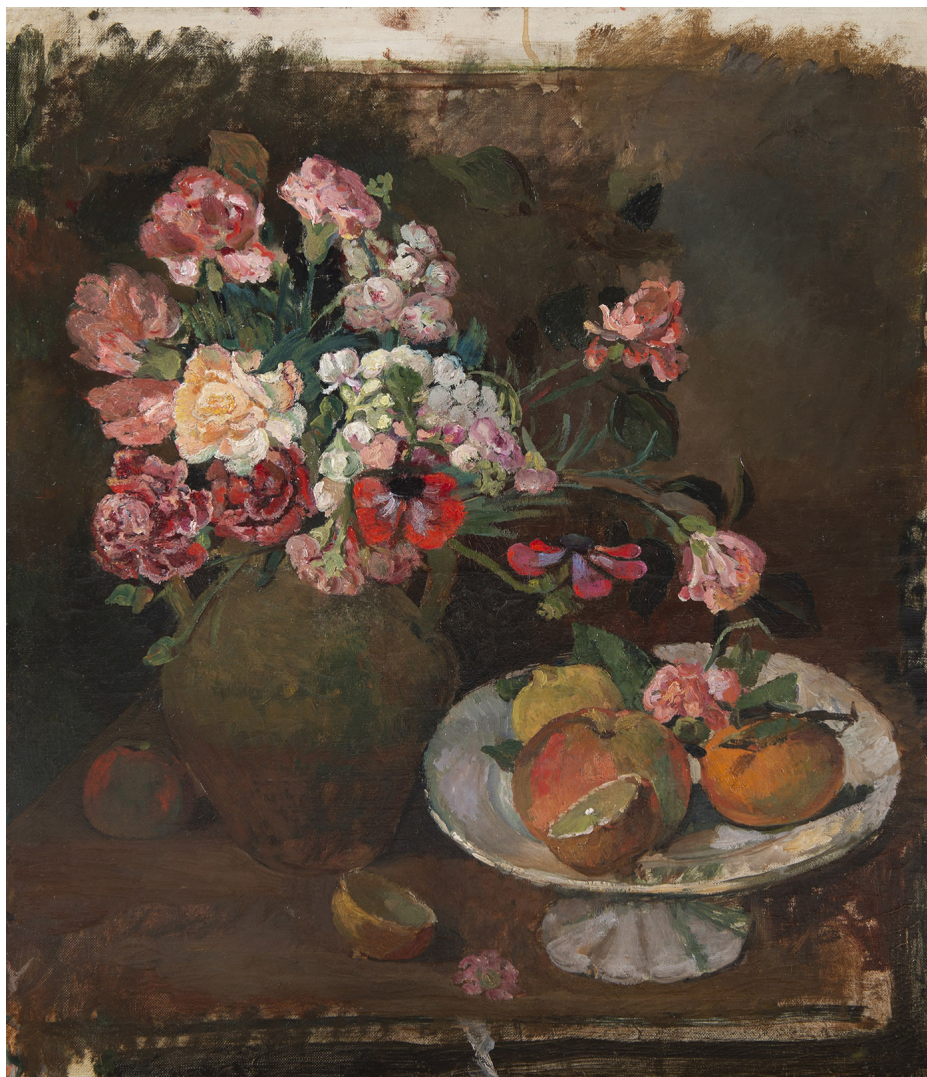
BLATHUS (1908-2001) Nature morte , Circa 1926-1930 Signé et monogrammé au dos : Balthus BK Huile sur toile, 65 x 54 cm