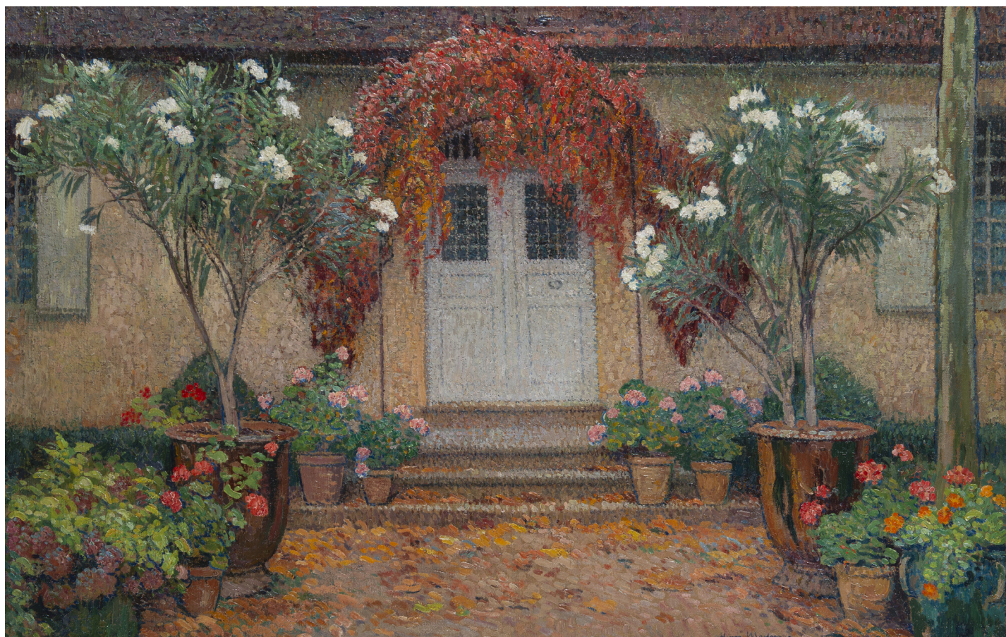
HENRI MARTIN (1860-1943) Automne, entrée principale de Marquayrol Signé en bas à droite : Henri Martin Huile sur toile, 80,9 x 130,4 cm