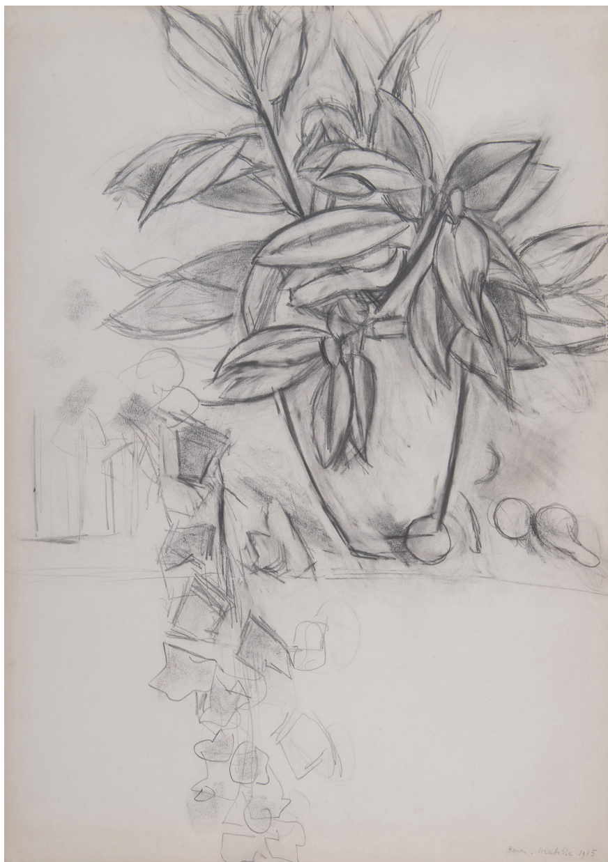
HENRI MATISSE (1869-1954) Nature morte au lierre , 1915 Signé et daté en bas à droite : Matisse 1915 Fusain et estompe sur papier, 75,5 x 56,5 cm