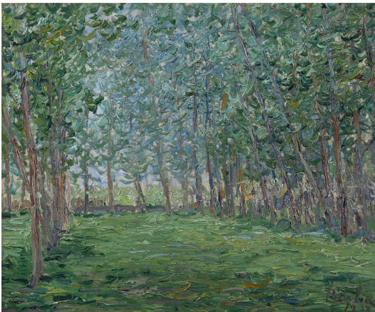
FRANCIS PICABIA (1879-1953) Champ près d'un bois , 1903 Signé et daté en bas à droite : Picabia ; 1903 Huile sur toile, 48 x 57 cm