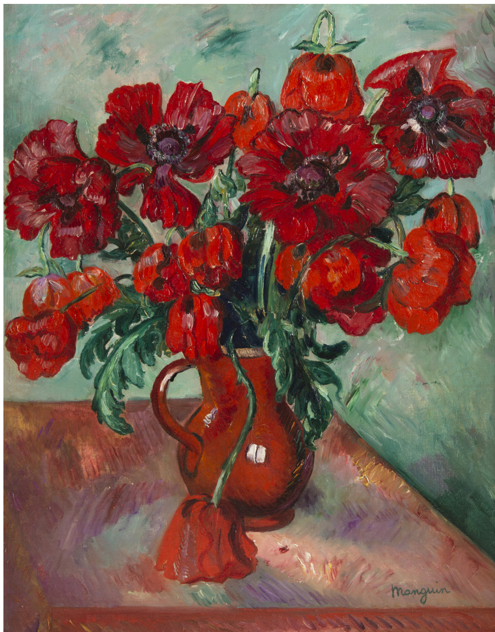
HENRI MANGUIN (1874-1949) Grand vase de pavots , 1915 Signé en bas à droite : Manguin Huile sur toile, 93 x 73 cm