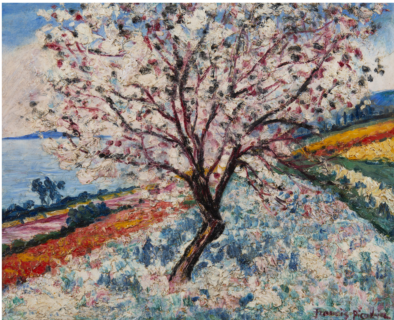
FRANCIS PICABIA (1879-1953) Arbre en fleurs , Circa 1938 Signé en bas à droite : Francis Picabia Huile sur toile, 46 x 55 cm