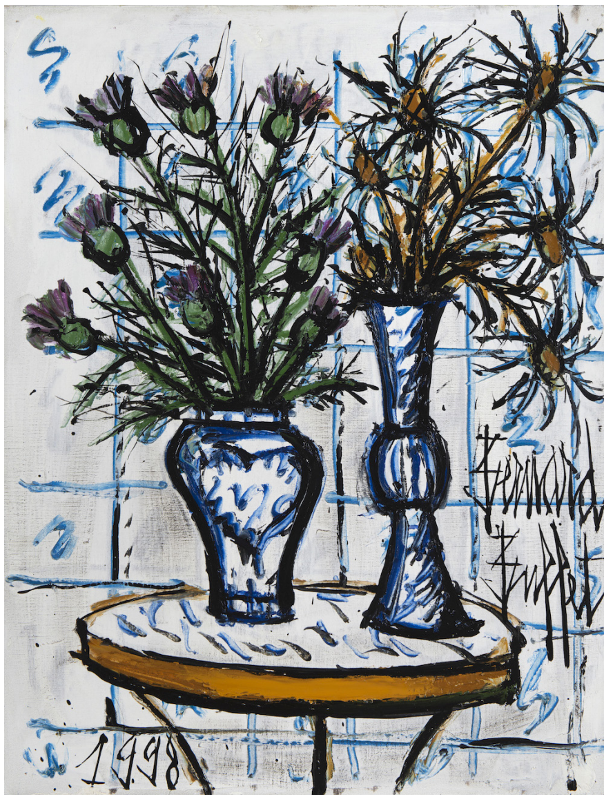
BERNARD BUFFET (19-1999) Vases de fleurs sur un guéridon , 1998 Signé en bas à droite : Bernard Buffet Daté en bas à gauche : 1998 Huile sur toile d'origine, 81 x 60 cm