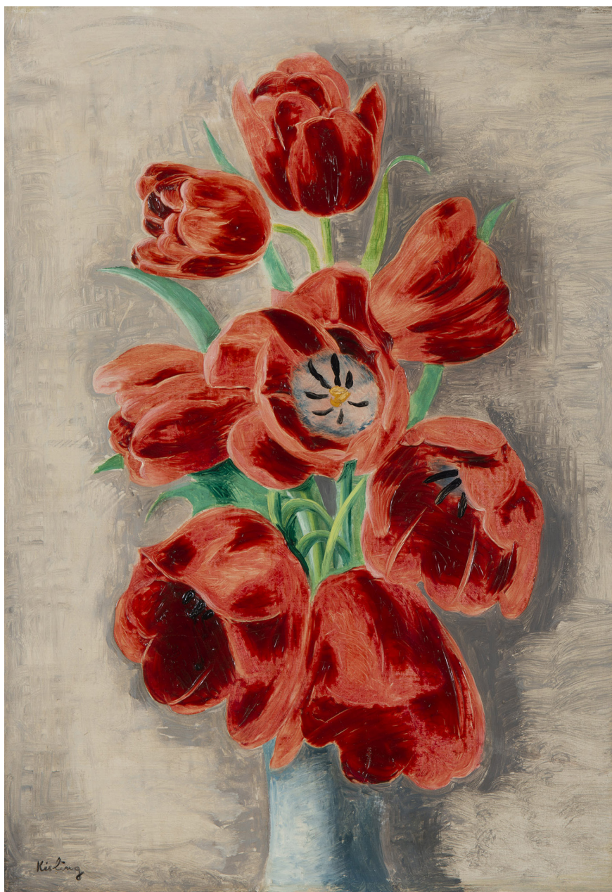
MOÏSE KISLING (1891-1953) Tulipes sur fond nacré , Circa 1928 Signé en bas à gauche : Kisling Huile sur toile, 55 x 38 cm