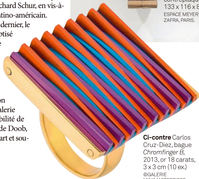
Ci-contre Carlos Cruz-Diez, bague Chromfinger B , 2013, or 18 carats, 3 x 3 cm (10 ex.) ©GALERIE MINIMASTERPIECE, PARIS.