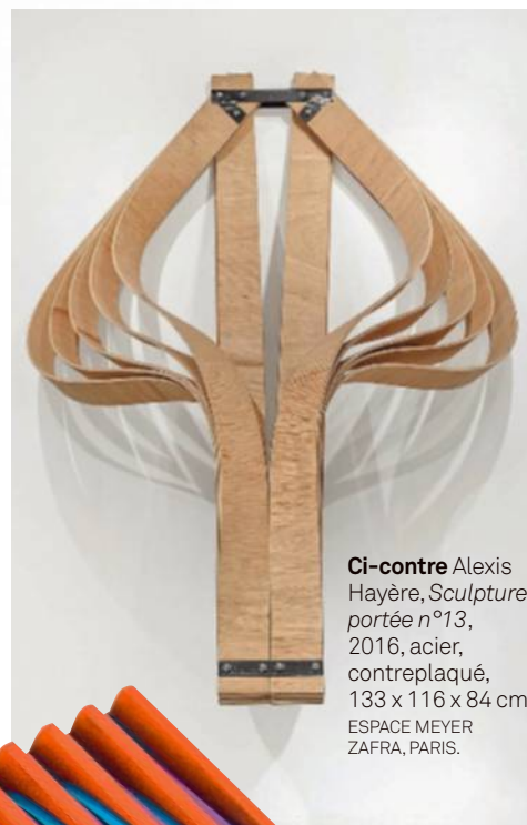
Ci-contre Alexis Hayère, Sculpture portée n°13 , 2016, acier, contreplaqué, 133 x 116 x 84 cm ESPACE MEYER ZAFRA, PARIS.

ART ÉLYSÉES-ART & DESIGN, et 8 e AVENUE, avenue des Champs-Élysées, 75008 Paris, de la place Clemenceau à la place de la Concorde, 01 49 28 51 30, www.artelysees.fr et www.8e-avenue.com du 20 au 24 octobre.